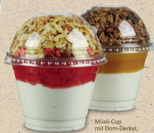
Müsli-Cup mit Dom-Deckel, 9oz (600010)