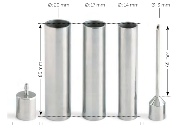
Conexión Spaghetti Spaghetti support